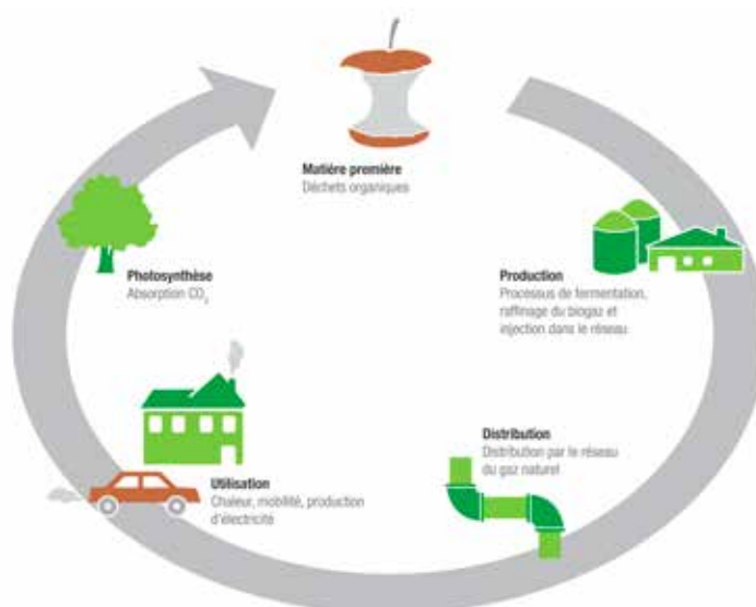
Le biogaz, un circuit naturel

Vous trouverez tous les sites des stations de remplissage de gaz naturel en Suisse sur www.gaz-naturel.ch/mobilite/stations-de-remplissage/